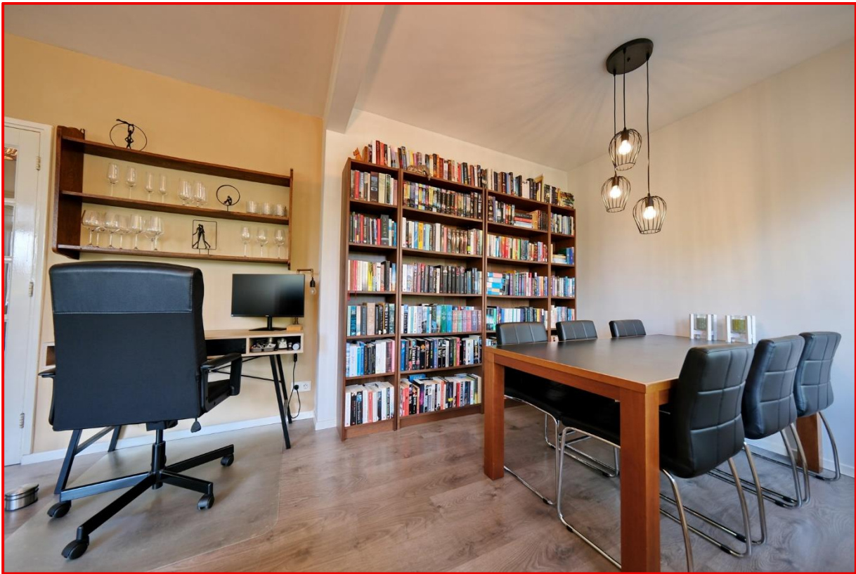
Anna van Burenlaan 202 te Ede