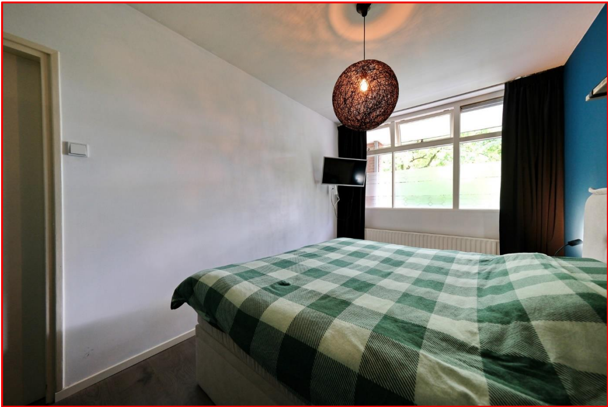
Anna van Burenlaan 202 te Ede