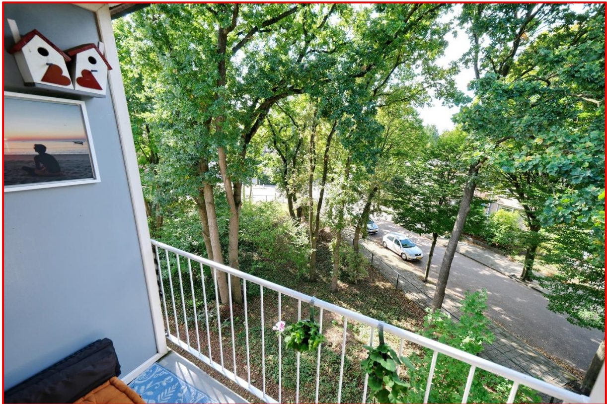
Anna van Burenlaan 202 te Ede