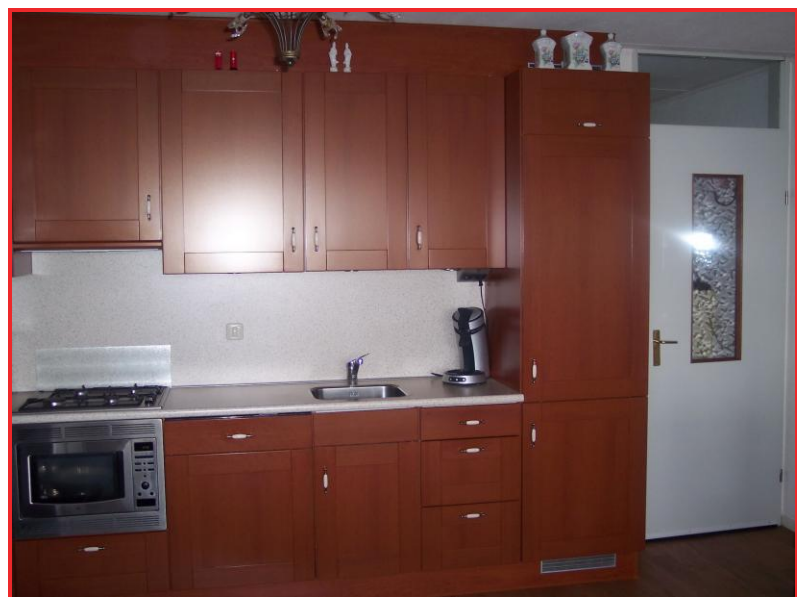
Ketelstraat 31 te Ede